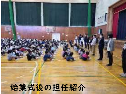
始業式後の担任紹介

春休み明けの初日となる「始業式」でしたが、体育館への入り方、待ち方、とても素晴らしかったです。特に6年生は、いちばん最初に体育館に入り、他の学年の子どもたちのよいお手本となっていました。