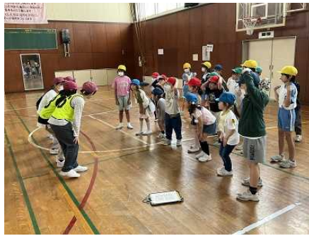
1年生を迎える会 (グループ遊び)