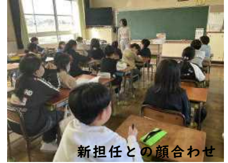
新担任との顔合わせ