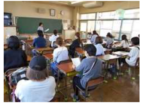
学年・学級懇談会