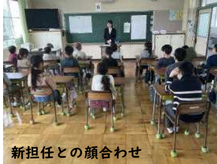
新担任との顔合わせ