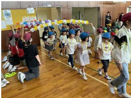
1年生を迎える会 (1年生入場)

これまでコロナ禍の影響で実施できなかった「1年生を迎える会」や「学年・学級懇談会」を実施することができました。1年生を迎える会では、1年生はもちろん全校の子どもたちの笑顔づくりのために、6年生が頑張ってくれました。